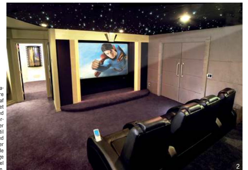
1: I USA er det en selvfølge, at udstyret i hjemmebiografen er det bedste af det bedste, så derfor er det i højere grad indretningen, man differentierer sig på. Ejeren af denne CEDIA-vindende hjemmebiograf ønskede sig et 'party palace', der kunne blæse gæsterne omkuld. Med sit 178 tommers lærred, græske søjler og sorte læderstole må det mål siges at være nået. 2: Endnu en vinder fra CEDIA Electronic Awards. Der er brugt fiberoptik til at skabe stjernehimlen, og væggene er beklædt med stof for at forbedre akustikken. Hjemmebiografen er også blevet kalibreret, hvilket vil sige, at lyd og billede finindstilles, så man får den bedst mulige oplevelse lige meget, hvor man sidder i rummet. Der skal som regel en installatør til for at klare kalibreringen.