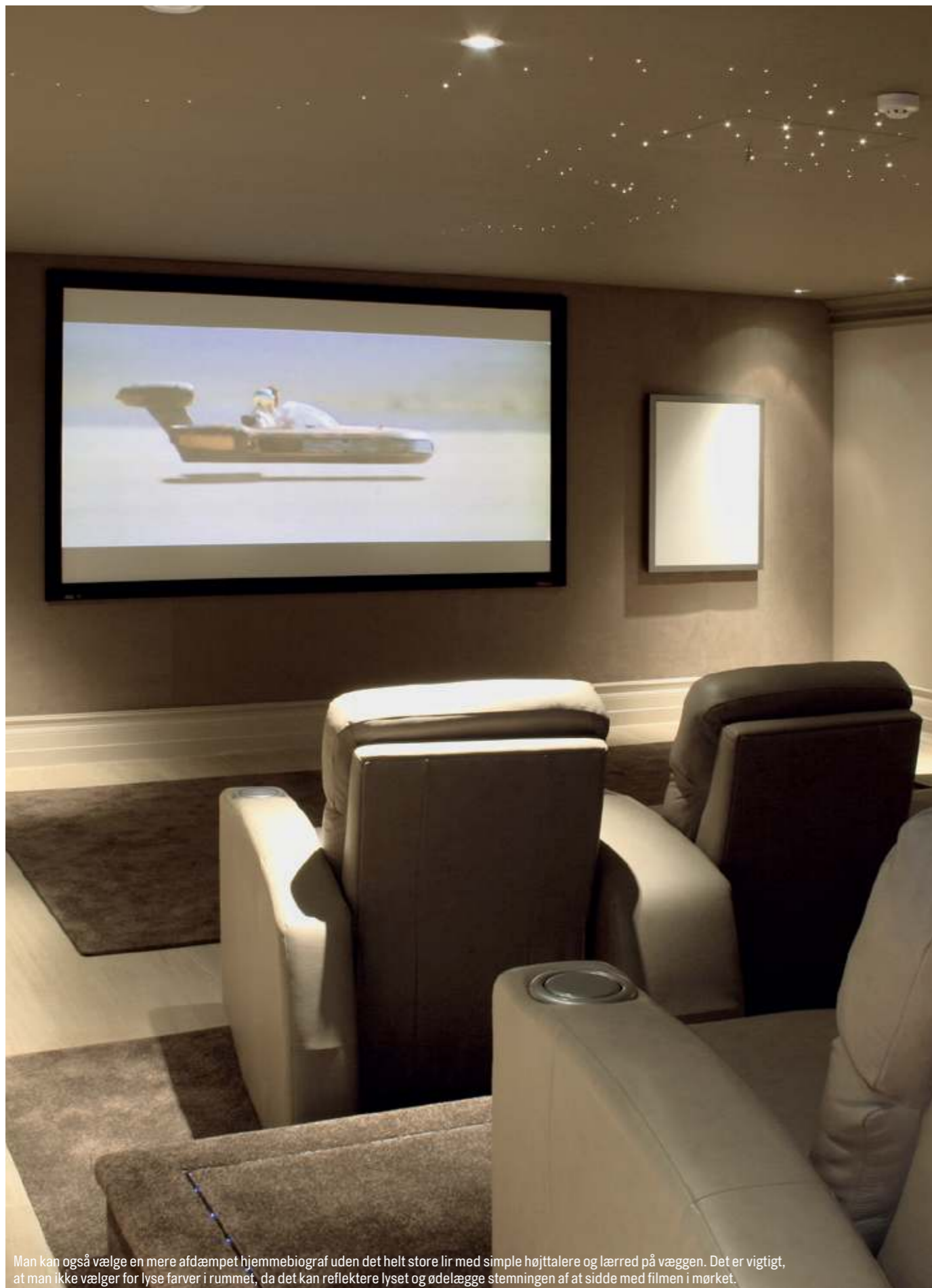
Man kan også vælge en mere afdæmpet hjemmebiograf uden det helt store lir med simple højttalere og lærred på væggen. Det er vigtigt, at man ikke vælger for lyse farver i rummet, da det kan reflektere lyset og ødelægge stemningen af at sidde med filmen i mørket.

foregå i en 'almindelig' stue," siger Carsten Overgaard.